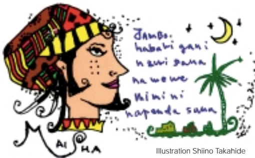
Illustration Shiino Takahide

18歳未満の方の入場はできません。また、未成年の方への酒類の提供は行いません。 ご入場の際に、身分証明書の提示をお願いする場合があります。あらかじめご了承ください。